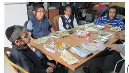
תלמידי כיתה ו' סיימו בס"ד

את משניות מסכת יומא ואף עשו סעודת סיום, יה"ר שיזכו לדעת את כל הששה סדרים בע"פ ובידיעה ברורה כשמש בצהרים.