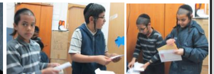
גם בזמן ההפסקה עוסקים במלאכת קודש מרצון ובשמחה