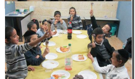
תלמידי כיתה ב' סיימו בס"ד את ספר 'יהושע' ואף חגגו זאת בשירים וריקודים וסעודת סיום, יה"ר שיזכו לסיים את כל התנ"ך כולו