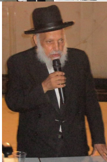
הרה"ג עובדיה יפעי שליט"א נושא מדברותיו