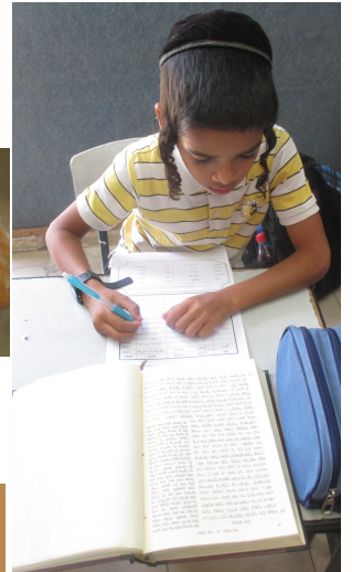
מתלמידי כיתה ג' שקועים במלאכת הקודש

מעט משקי הבמבה והכיפלי ועוד הפתעות וממתקים רבים, המחולקים מידי יום לתלמידים, על לימודם והתעלותם בתורה הקדושה, והתנהגותם הנפלאה אשר היא לתפארת