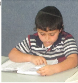
מתלמידי כיתה א' אצבע באצבע יהלכו