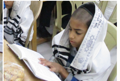
מתלמידי התלמוד תורה באשמורות