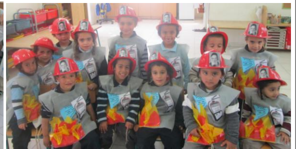
מכבים את האש