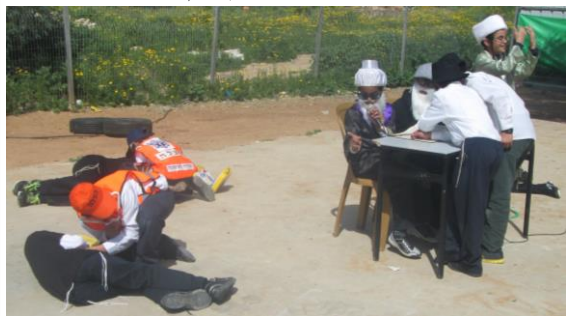
מפנים ברסלבי שהתעלף מרוב ריקוד