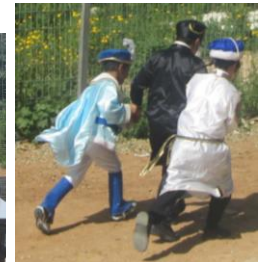
האבות מבקשים על בניהם שאבדו הכרתם עקב שהפריעו לרמב"ם ומארי יוסף בן סאלם ללמוד