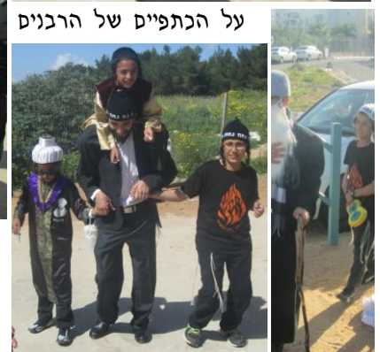
על הכתפיים של הרבנים