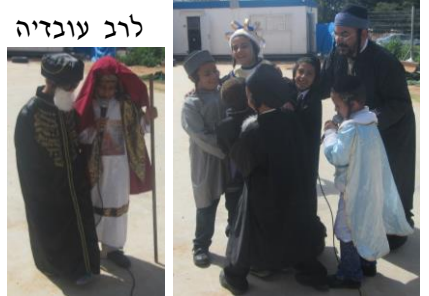
משה רבינו מסביר סוגיא לרב עובדיה