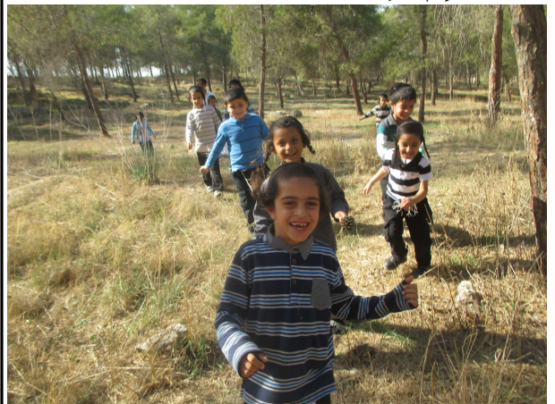
בעטרת חיים משקיעים ביראת שמים בלימוד התורה, אך חשוב מאוד שהכל יהיה בשמחה כיתה א' מתרעננים ומחליפים כוחות ביער