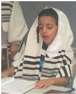
מהיום יום: תפילה זכה וטהורה