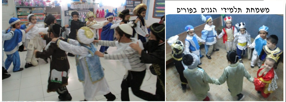
משמחת תלמידי הגנים בפורים