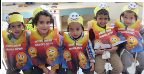
(יהודי צעדה והסביבה עמ' 94)