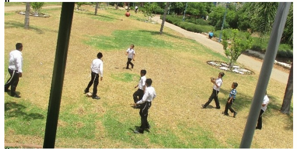
ילדים מתוקים מהוואי הגנים