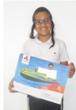
יהא רעוא שיעלה מעלה בתורה וביראה

אוהבין זה את זה התלמיד הנעלה מולאבי דורחי ני"ו