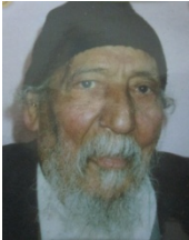
נפטר ו' מנחם אב תשנ"ב