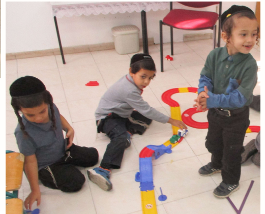
נהנים יחדיו במשחקי חברה