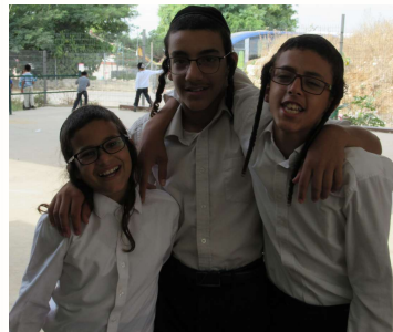
שתהיו אוהבין זה את זה...