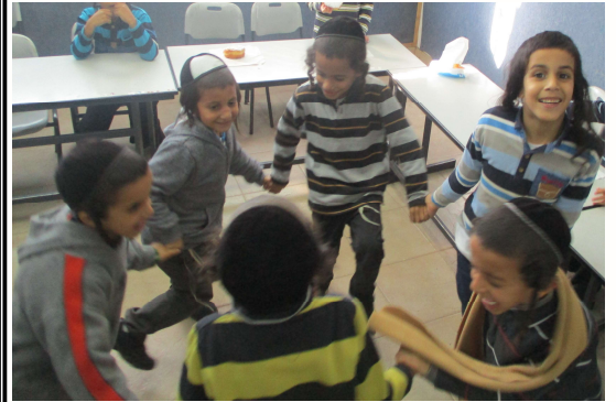
תלמידי הגן בפעילות חווייתית בימי חנוכה