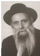
נפטר י' סיון תשנ"ח

נולד ערב חג השבועות ה' סיון ה'תרע"ח בכפר סחול בני שמסאן שבמחוז איב. התייתם מאביו בגיל שמונה. רבותיו סבו הרב סעדיה שאער והרב אברהם שחב והרב יעקב משה חרל"פ. כבר בילדותו נתגלה כבעל כשרון. קיבל הסמכה לשחיטה גם לבהמה גסה קרוב לגיל חמש עשרה. בדרכו לארץ לימד תורה בעדן בשהותו שם. כשהגיע ארצה בשנת תרצ"ז למד בישיבות בירושלים. בגיל כ"ד כיהן כר"מ בישיבת אור המזרח. עסקן ציבורי גדול. רב שכונת מחנה יהודה בפ"ת אב"ד, וחבר ב"ד הגדול. חיבר שירים וחיידושי תורה שעדיין חלקן הגדול בכתובים.