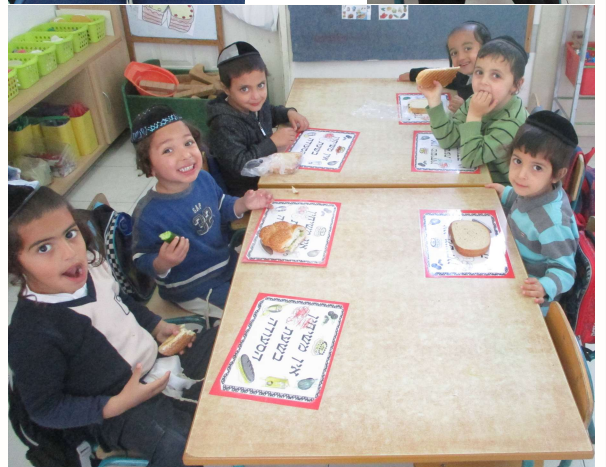
סועדים את לבם בדרך ארץ