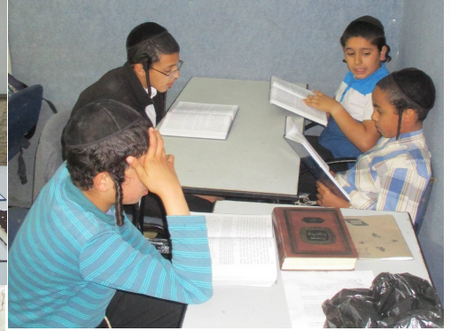
בסוף זמן חורף משוניים את כל מה שלמדו מתחילת שנה עד עתה, ל"ה פרקים של הנביא יחזקאל