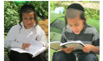
משננים גם בחצרות...

תלמידי כיתה ב' זכו לסיים את פרשיות צו ושמני ואף עשו