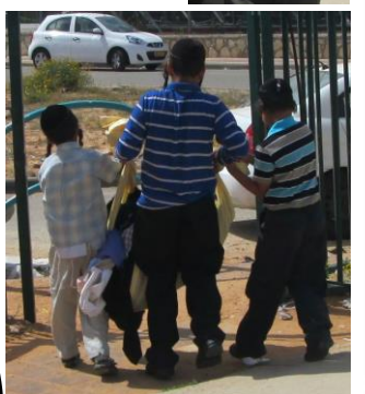
בעלי חסד, על זמן הפסקה. ירבו כמותן..

המבצע בעצמותנו!! זשאיות הארטיקים זהטילונים!! לא מצטיקה להעניא!!