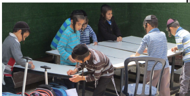
חינוך למלאכת מצוה מנקים לפסח

הרב זכריה הלבן (אלאביק) זצ"ל ממנהיגי ומדייני העיר כוכבאן בשנות ה'תרמ"ז. ולמה קראו שמו הלבן, שנולד ביום הכיפורים בשעת הנעילה, וכבר נתלבנו עונותיהם של ישראל, בסוד אם יהיו חטאיכם כשנים כשלג ילבינו. גדול ונורא שמו אשר בתפילתו שינה הטבע ונקם בצוררי היהודים עד האחרון שבהם, כמובא המעשה באריכות בספר 'קורא הדורות' פרק כ"ז מהדורת נוסח תימן.