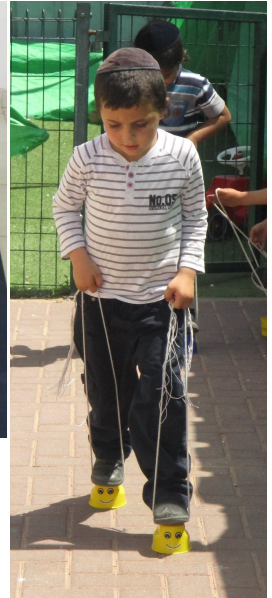
מפעילות ילדי הגנים בלע"ה איזה שמחה ומאור נסוכה על הפנים