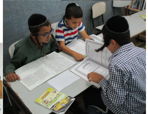
ילדי הגנים במלאכתן, יגיע כפך כי תאכל...