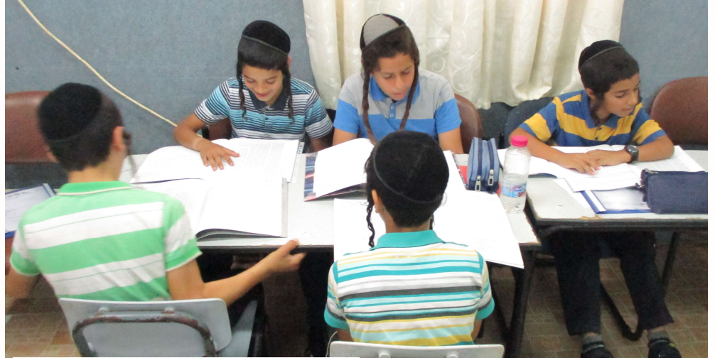
בעמלה של תורה חוזרים ומשננים את הסוגיא