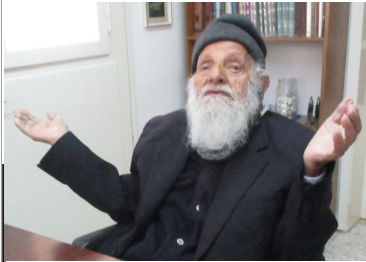
פוקר ידיו בערגה וכיסופין לבורא עולם, בעת אמירת תהילים עם התלמידים