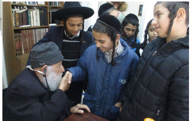
המארי מנושק ילדי התלמידים. איזו ענוה!!