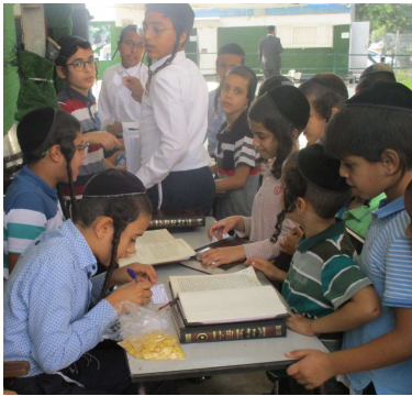
במקום לשחק בהפסקות, באים להבחן בעל פה על פסוקים ומשניות וצוברים נקודות