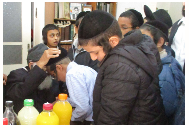
התלמידים מתברכים אישית מפי המארי