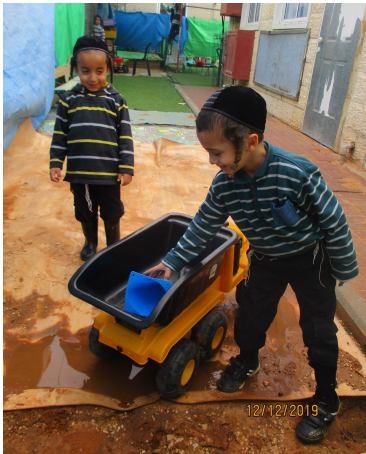
שמחת חיים כתובתה ומצאת בעטרת חיים