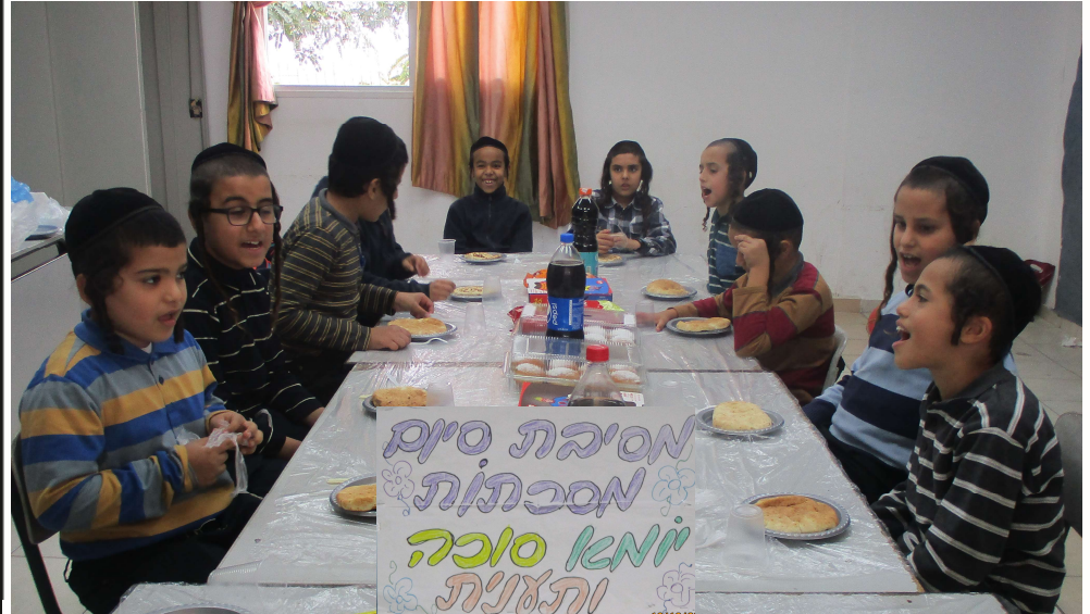
תלמידי כיתה ד' חוגגים סיומי מסכתות ראש השנה, סוכה ותענית (את השלט הכינה אחת האמהות, תבורך מפי עליון) יה"ר שיזכו לברך על גמרה שלתורה, ויעלה מעלה ברוחניות ובקדושה, אכ"י"ר