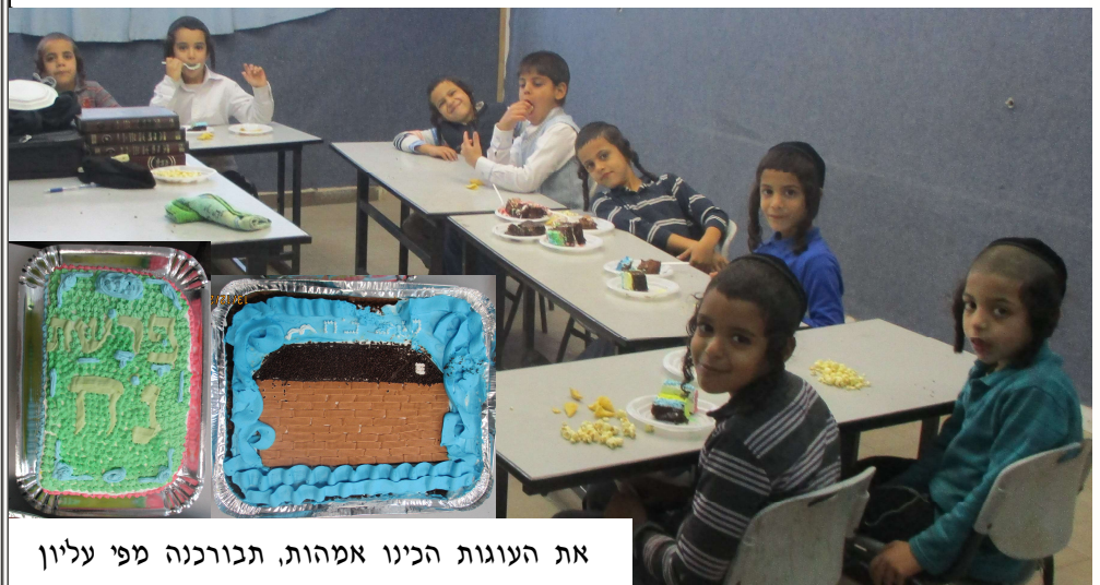
את העוגות הכינו אמחות, תבורנה מפי עליון

יה"ר שיזכו לברך על גמרה שלתורה, ויעלה מעלה ברוחניות ובקדושה, אכ"ר