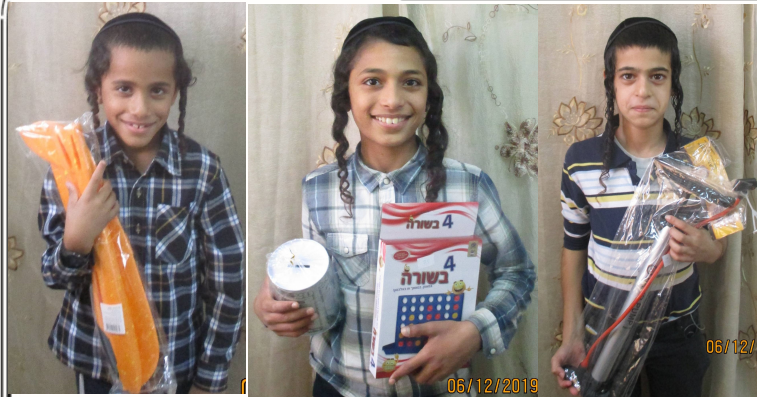
תלמידי כיתה א' חוגגים סיום פרשת נח