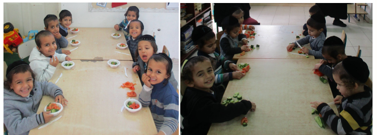
גדול הנהנה מיגיע כפיו...