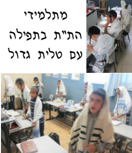
מתלמידי הת"ת בתפילה עם טלית גדול

וכל זה תלוי גם כיצד נראית הציצית בלויה וקרועה או כחדשה ויפה, שאם הבן רואה שלא מתקיים בציציתו יזה אלי ואנוה' אין סבה שיעריכנה, ויתבייש ללבושה וגדול כבוד הבריות. ואם היא גדולה יותר מגופו או קטנה לגופו או שאינה נקיה וכו"ב, אזי תציק לו וימאס בה. ואם ציציתו פסולה לא יזכו הילד והוריו למה שכתב השל"ה. ע"כ לא יחסוך אדם בממונו בהוצאות מצוה זו, ולא יחסוך במילים לבניו בשבח מצוה זו. ועמלו וטרחתו רואה זאת בנו ומפנים כמה חשובה ויקרה מצוה זו, ועי"כ ידע להעריכנה ולהקפיד בה. ויזכה לשמירה מעולה ולנשמה גבוה, אכ"ר.