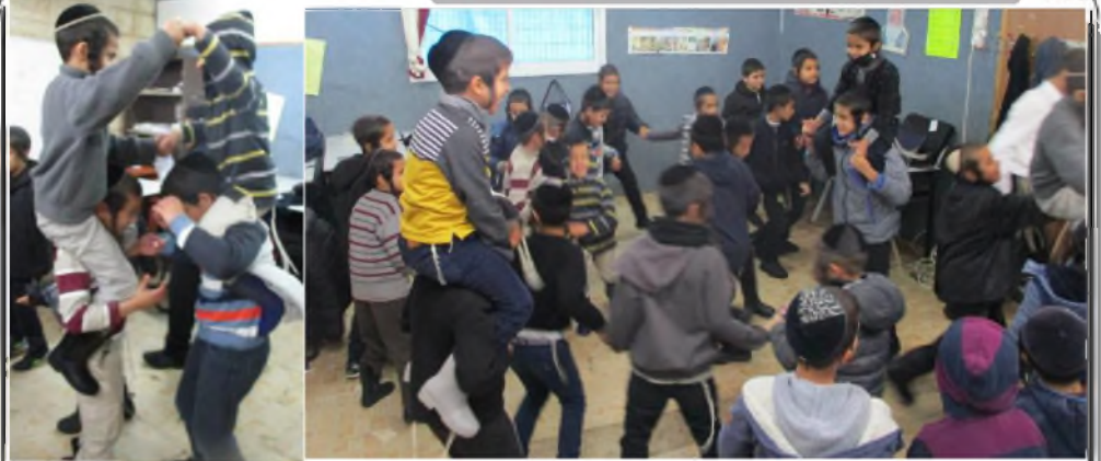
משנכנס אדר מרבין בשמחה... שמחה פורצת גבולות... התלמידים הגדולים מרמים את הקטנים על כתפיהם... ישנו עם מפורז... ונהפוך הוא..