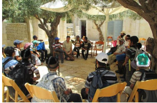
בקבר הרב מרדכי שרעבי