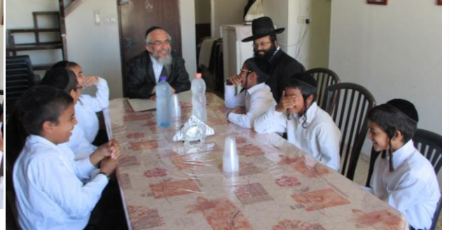
מרן נהנה ושמח עם התלמידים