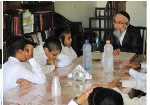
מרן מקשיב לשאלותיהם