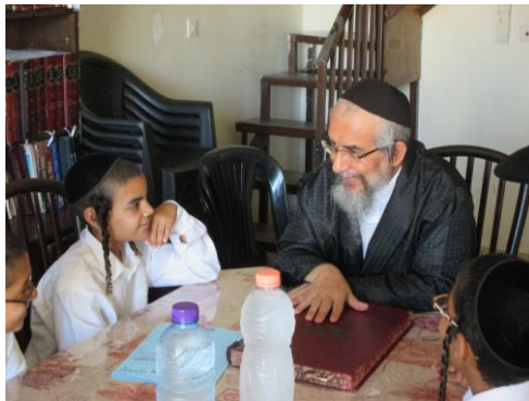
מרן מתפלפל עם התלמידים