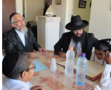
מרן שומע כל תלמיד בקריאת הגמרא בגירסת אבותינו

כיתה ה' סיימו בס"ד את כל פרק אלו מציאות בידיעה והבנה ברורה ונכנסו לקודש פנימה להיבחן אצל מרן נשיא המוסדות הגאון רבי יצחק רצאבי שליט"א אשר שמח בתשובות התלמידים והאריך עמהם כחצי שעה על אף זמנו היקר והזדחוק לאחר מכן יחד עם כיתה ו' התרעננו בפארק קנדה וחזו והתפעלו מנפלאות הבריאה וסעדו לבם בצלי אש וחזקו גופם במתקנים במושב בית עריף