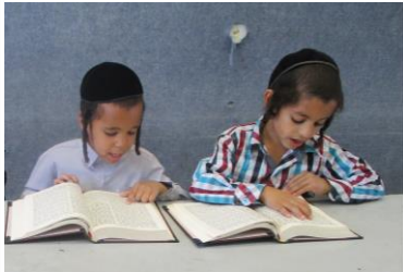
תמונות ששוות אלף מילים

הרב יחיא בן משה קרוזאני זצ"ל נולד בצנעא בשנת ה'ת"נ. שימש כדין בבית הדין בצנעא. גם היה סופר המעתיק ספרים. נפטר בצנעא בשנת ה'תכ"ה. תנצב"ה