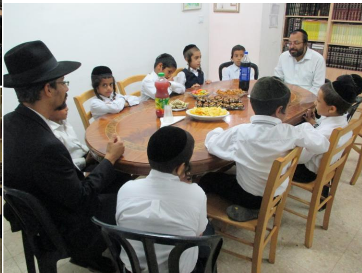
כיתה ד' חגגו סיום חומש בראשית ומשניות מסכת בבא מציעא בסעודה דשינה. יה"ר שיסיימו את כל הששה סדרים, אכ"ר