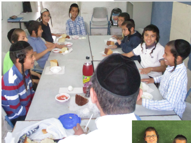
מתלמידי הגנים בלימוד אצל המארי