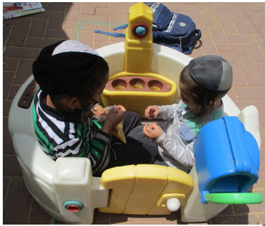
ושתהיו אוהבין זה את זה...

הרב משה בן אלעזר כהן זצ"ל היה ראב"ד בעיר מוכיא שבדרום מערב תימן לפני כארבע מאות שנה. תנצב"ה.