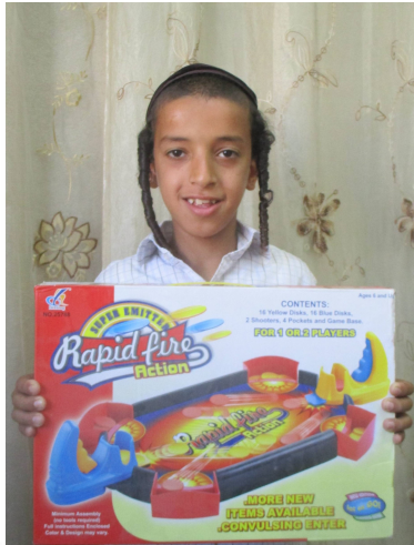
הצטיין משהו מיוחד!!!! קיבל פרס מיוחד!