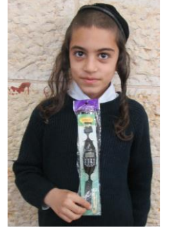
תלמידי מכינה ב' בסעודת ראש חודש