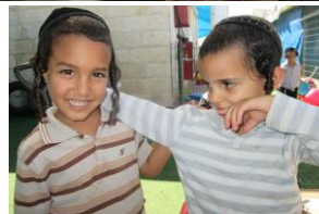
ושתהיו אוהבין זה את זה...