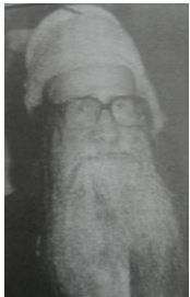
נפטר בפתח תקוה בש"י שבט תש"י

עלה לארץ ישראל בשנת תש"י. עליו ראה בספר אהל יוסף.