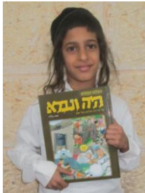
שמחת חנוכה במכינה ב'

אזרח חיה! בשמו רמז שם ה' ושה' עמו, מי הוא, וכיצד רמזו? בין הפותרים נכונה יוגרל פרס