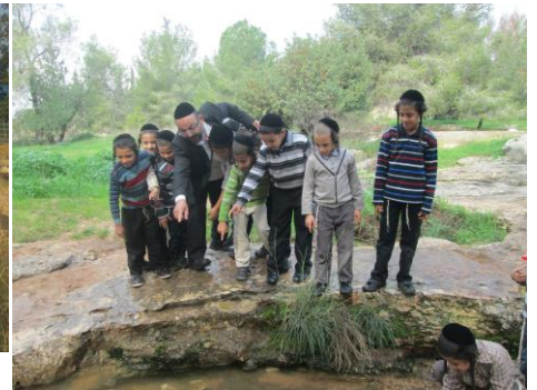
כיתה א' נופשים ומתרעננים סביבות אלעד