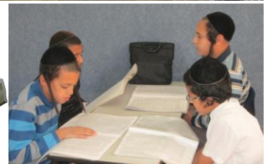
או חברותא... מרגישים ישיבה בת"ת