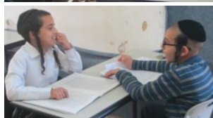
כולם רוצים להיות כמוני!

כס'מנא טבא וד'יא יאה נאח'א פספחה שמח'א ר'ר'א פוא'דת האנן. יה"ר שיזכו ל'הכניסו בקריתו ה-אברהם אפינו ויזכו ל'אדלו לתורה ל'חופה ול'מצעים טובים