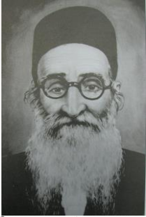
בין הפותרים נכונה יוגרל פרס