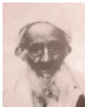
נפטר בצנעא בשנת תרצ"ט