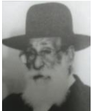
נפטר בהוד השרון בכ"ב כסלו תשנ"ז