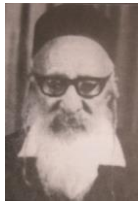
נפטר בהרצליה בכ"ח באב תשל"ח

הרב שלמה ב"ר יצחק נדאף נולד במקוית בכ"ג בשבט תרנ"ג. בר אורן ובר אָבְּקוֹן. הורשה לשחיטה על ידי הרב הראשי מארי יחיא יצחק הלוי. שמש ברבנות במקוית ועמדו בקשרי מכתבים עם רבינו יחיא יצחק. עלה לארץ ישראל בשנת תשי"ט. קבע משכנו בשכונת "נוה עמל" בהרצליה, שם הרביץ תורה לרבים. ממיסדי בית הכנסת "שערי צדק" בהרצליה.