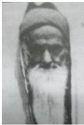
נפטר בירושלים באדר ב' תשי"א

נולד בצנעא בשנת תרל"א. מרבני הישיבה הכללית. תלמיד חבר לרב הראשי מארי יחיא יצחק הלוי, וחבר בית דינו. היה ממונה להסמיק רבנים ושוביים. הניח תשובות בכתב יד. בשנת תשי"ט עלה לארץ ישראל.