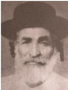
נפטר ברחובות בכ"ו אדר תשל"ז