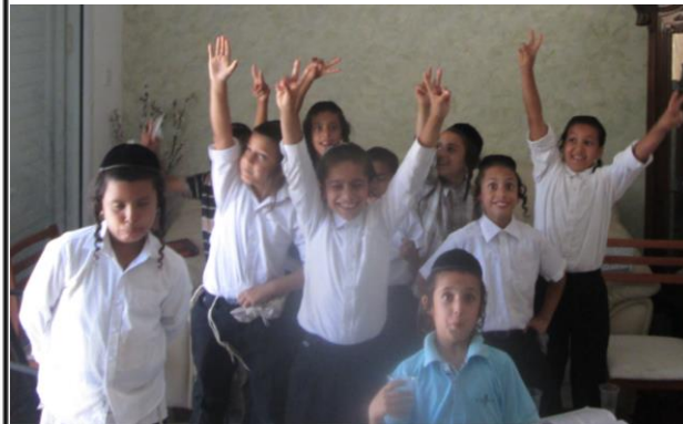
כיתה ב' נופשים בבית מחנכם