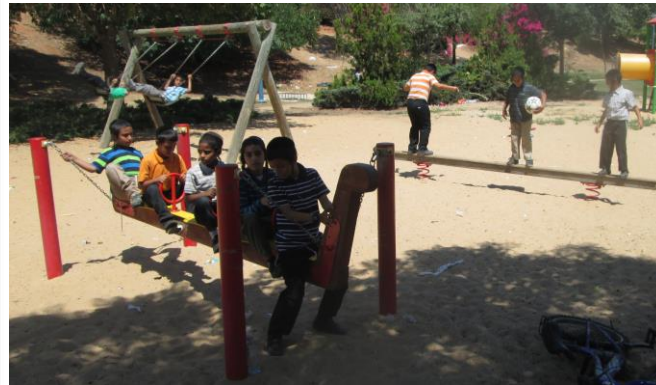
כיתה ג' מתרעננים בטיילת

תלמידי מכינה ב' אשר חגגו בכ"ט סיון מסיבת סידור מיד לאחר מכן הביאו כמה מהם את הסידור להתפלל מתוכו לקיים בהם אותיות מחכימות אשריהם בנים של-מלך!