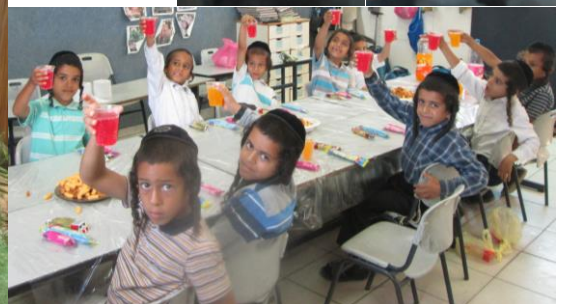
כיתה א' לכבוד ראש חודש

מרכת מסי'אנא סבא וד'א יאה נאחא אנפסחת אהרון ה"ו ארלא הולדת נאט יה"ר שניכו אדגלו א'תורה אנאות לחופה ו'אמצים סוביס