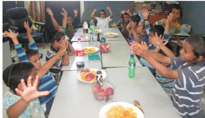
לכבוד הילולת האור החיים הקדוש