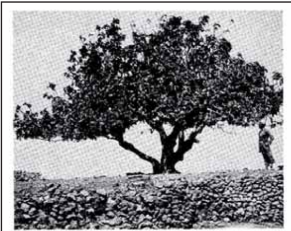
עץ תאנה לפני המכה (תרע"ה)

והרמב"ם והרא"ש והרשב"א והרמב"ן והר"ן ורובנו ירוחם והטור