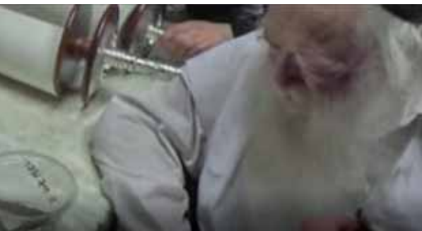
מרן הגר"ח קנייבסקי והחגבים