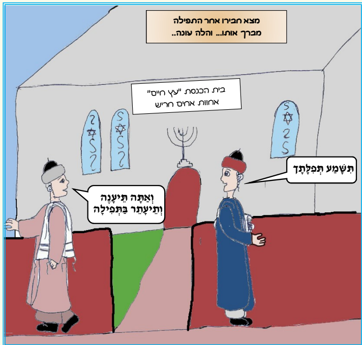
כל הזכויות שמורות למערכת "נחלת אבותינו" אין לשכפל ולצלם ללא רשות בכתב ממערכת העלון