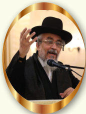
מתוך שולחן ערוך המקוצר של מרן הגאון רבי יצחק רצאבי שליט"א