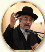
מתוך שלחן ערוך המקוצר של מרן הגאון רבי יצחק רצאבי שליט"א

והיה עקב תשמעון את המשפטים האלה" - פירש"י - אם המצוות קלות שאדם דש בעקביו תשמעון, ישמור לך הבטחתו. בעלי המוסר מסבירים זאת כך, יש הבדל עצום בטבע האדם בקיום מצות תדירות לשאינן תדירות, לדוגמה: כאשר אנו זוכים לשמוע קול שופר בראש השנה, איזו התרגשות, איזו כוונה, איזו דממה. שעת נעילה ביום הכיפורים אנו כבר ממש עם המלאכים. ביום הראשון של סוכות, כל גופנו בתוך המצוה מוקף באורות! ובשעת נטילת לולב מקיימים את המצוה בשמחה בהתלהבות וכו'.