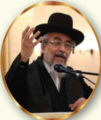
מתוך שלחן ערוך המקוצר של מרן הגאון רבי יצחק רצאבי שליט"א