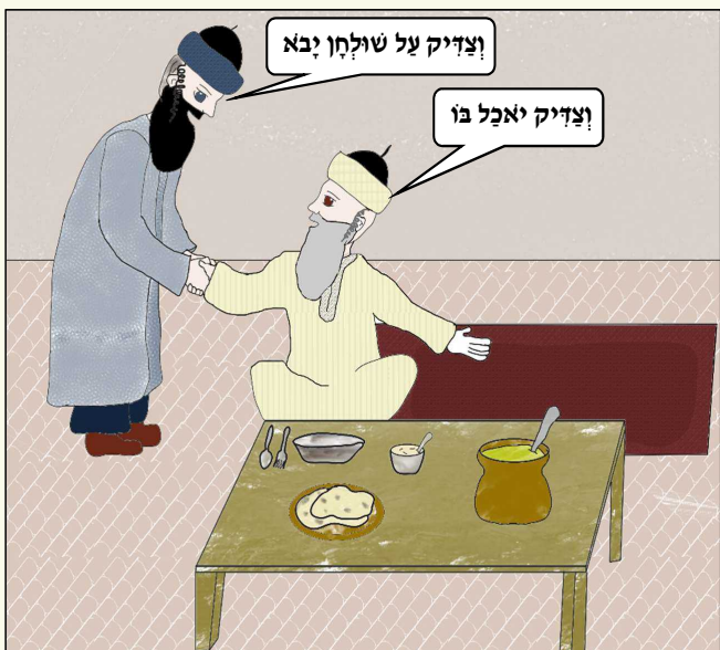
כל הזכויות שמורות למערכת "נחלת אבותינו" אין לשכפל ולצלם ללא רשות בכתב ממערכת העלון

וילמדו כפי יכלתם פירושי התפילות והפיוטים, והלכות התקיעות בספרי רבותינו הפוסקים. וגם ילמדו בספרי מוסר המעוררים את לב האדם לירא מפחד ה' ומחדר גאונו בקומו לשפוט את הארץ. ומהטוב שילמד גם־כן סודות התקיעות, אם הוא ראוי לכך: