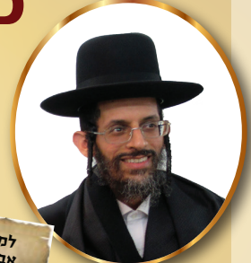
ראש הכולל הרה"ג משה רצאבי שליט"א