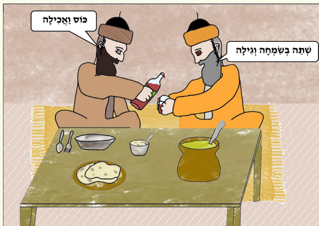
כל הזכויות שמורות למערכת "נחלת אבותינו" אין לשכפל ולצלם ללא רשות בכתב ממערכת העלון

חילוקים. והנה על פי הגמרא והגאונים והרמב"ם תוקעים רק מ"א תקיעות, שלושים מיושב ועשר מעומד ותרועה גדולה, ויש מהבלדי שנוהגים כך. ויש מהבלדי שמוסיפים ותוקעים ע"א תקיעות, ומנהג השאמי (דרך-כלל) ק"א. ויש אומרים שלאחר גמר התקיעות כפי מנהג המקום, אין לתקוע יותר אפילו מי שרוצה להתלמד כדי לתקוע ביום שני, זולת קטנים מותר לומר להם שיתקעו ואף מותר להשתדל ללמדם. אבל מנהגינו להקל שאפילו גדולים תוקעים ללא צורך. ולכולי עלמא השופר אינו מוקצה: