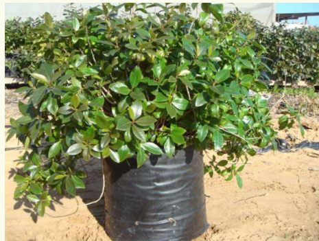
אסור לנטוע עץ קאת בשביעית.