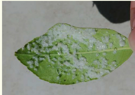
מותר להשקותן כדי שלא ימותו או שלא יפסדו העלים. והשקאה מרובה גורם לו מחלה (פטריה 'קימחון').