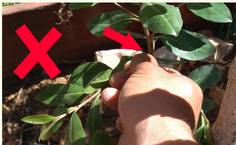
אין קוטפים את עלי הקאת כדרכם בשאר שנים, דהיינו שמדקרים לחתוך הענף עם העלים סמוך לפני העין, מפני שזה מועיל להם לחזור ולגדול מן הצד אחרי זמן קצר מאשר אם יקטפו סתם באמצע.