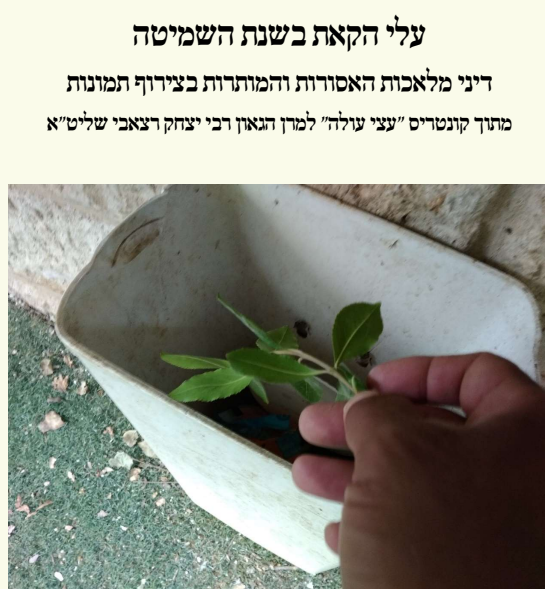
עלי הקאת אין להם דיני קדושה וכיו"ב בשנת השמיטה.