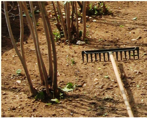
אסור לחרוש ולעדר סביבות העצים.